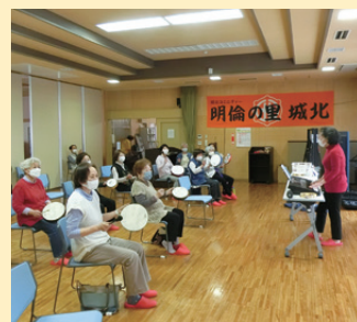
2022年5月音楽活動講座より